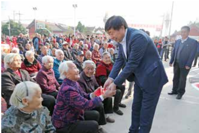
重阳节为南勋村老人发放补助金

2020 年春节刚过，新型冠状病毒肺炎疫情肆虐全国。面对疫情蔓延，金利集团发出了“抗疫复工两不误”的动