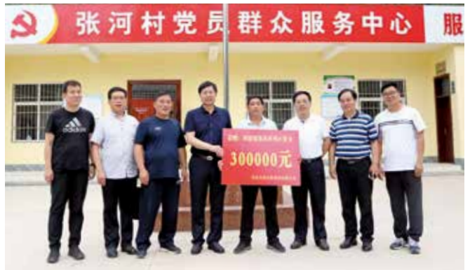
向张河村捐助项目资金