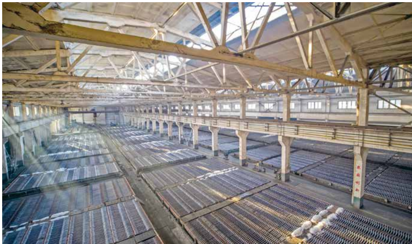
金利集团电解铅生产线