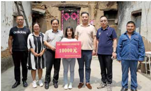
资助张河村贫困学生大学助学金