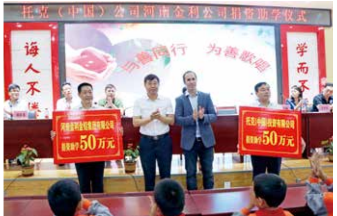
与托克（中国）联合向承留小学捐赠100万