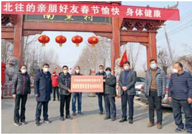
为南勋村防控疫情捐款